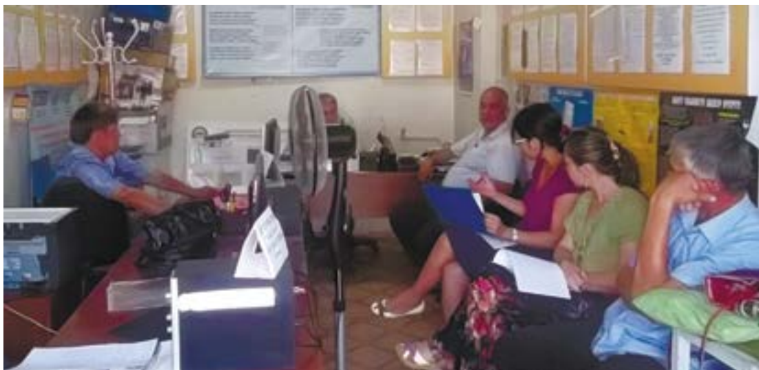
Фокус-группа с членами ОПЦ, г. Ош

В Джалал-Абадской и Иссык-Кульской областях активисты заявили о несправедливости и закрытости процесса отбора членов профилактических центров.